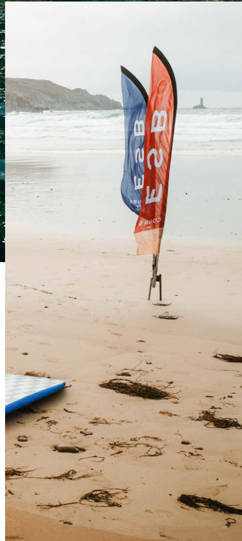
Rechts: Die Baie des Trépassés ist wegen ihres flachen Sandstrands und der zuverlässigen Brandung bei Surfer:innen sehr beliebt.