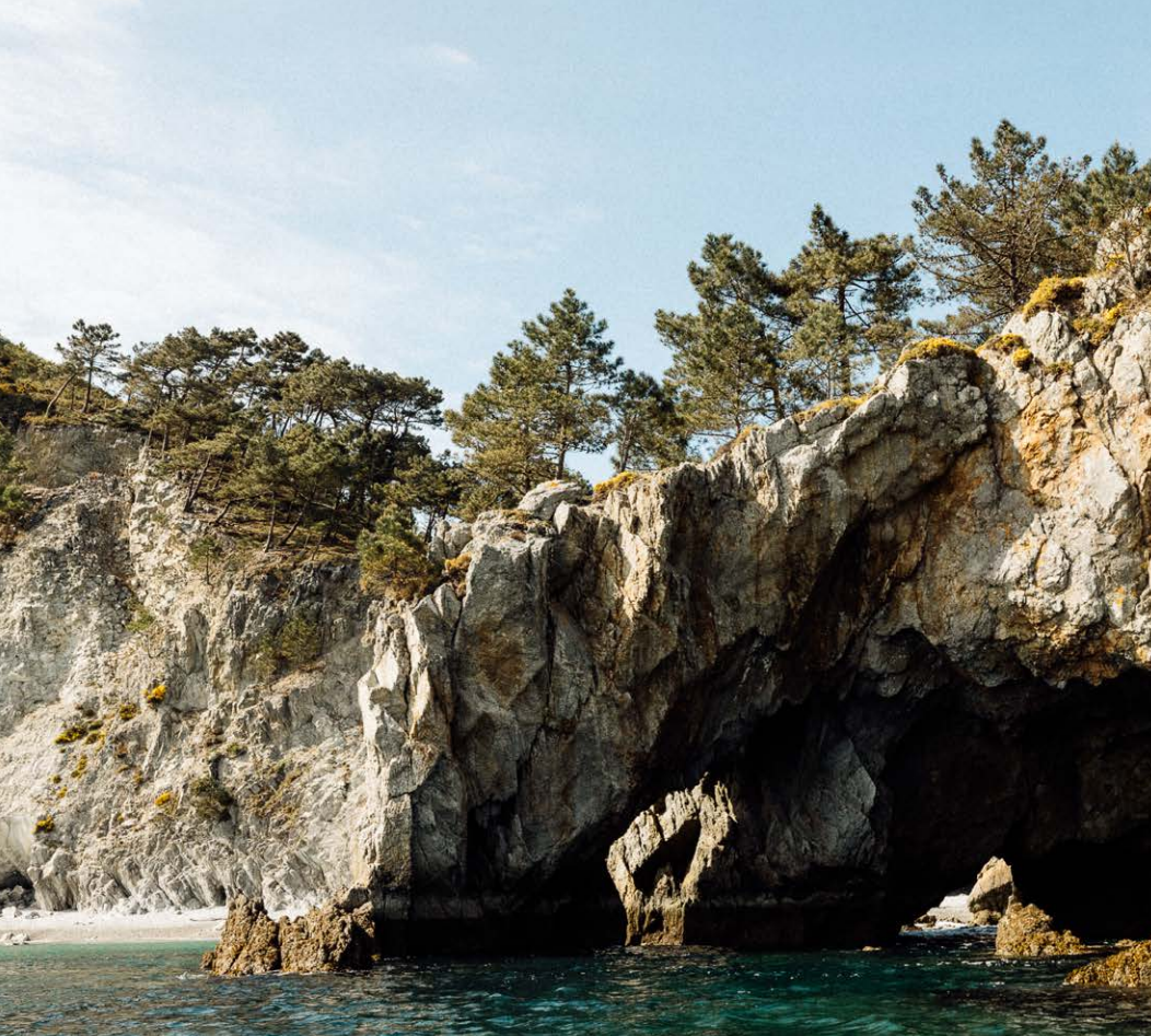
Oben: Die «Plage de l'île Vierge» ist nur vom Wasser aus erreichbar, zum Beispiel bei einer Kajaktour.